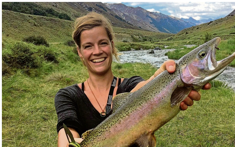
Forel gevangen in Nieuw-Zeeland.