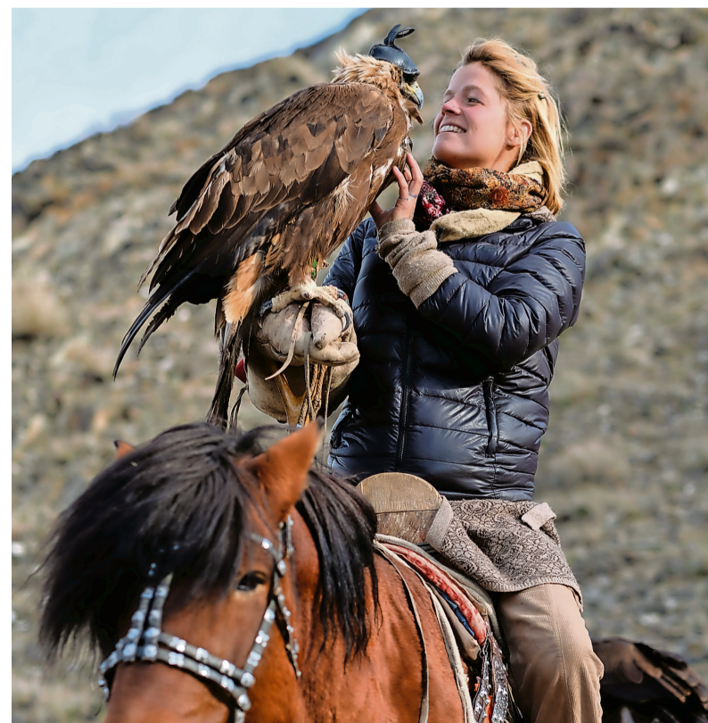
Op een paard met een adelaar in Mongolië.

„ Ik wil graag bij de plaatselijke bevolking de nomade zelf zijn. Dus een van hen zijn